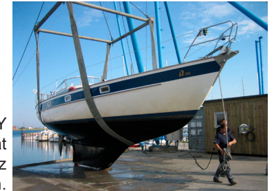
Unsere SY Aldebaran hat ihren Liegeplatz in Heiligenhafen.