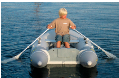
Das Schlauchboot gehört zur Ausrüstung ▶