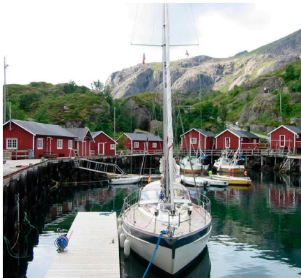
◀ SY Aldebaran im Nusfjord (Lofoten)