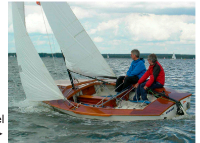
Schwertzugvogel „August“ ▶

Wir bieten auch unkompliziertes Jollensegeln auf dem Steinhuder Meer. Es steht der Schwertzugvogel „August“ zur Verfügung. Die Jolle kann von den Vereinsmitgliedern unentgeltlich genutzt werden. Durch eine Kooperationsvereinbarung mit dem Verein Teilboot e.V. kann auch auf deren Jolle gesegelt werden.