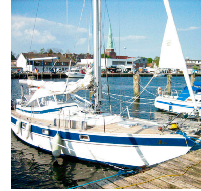
Die SY Aldebaran ist ein schönes und sicheres Fahrtenschiff mit 10,54 m Länge, 3,38 m Breite, 1,67 m Tiefgang und mit 6 Kojen.