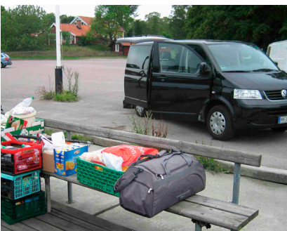
◀ Crewwechsel mit unkomplizierter An- und Abreise